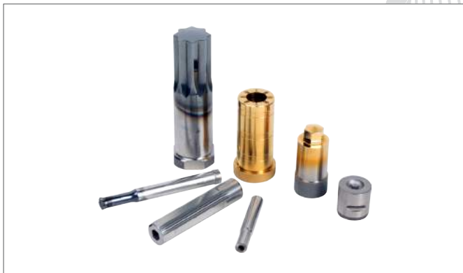
3. Hex , Torx Pin & Special Form Pin類