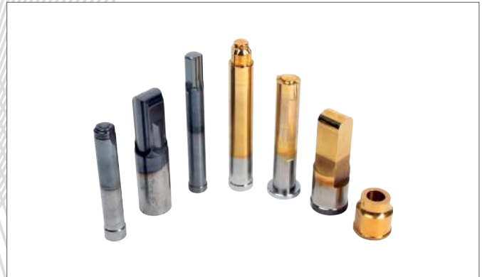
2. Parts Former and Press Steel & W.C(초경)금형類