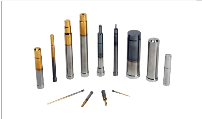
1. Bolt Former Steel & W.C(초경)금형類