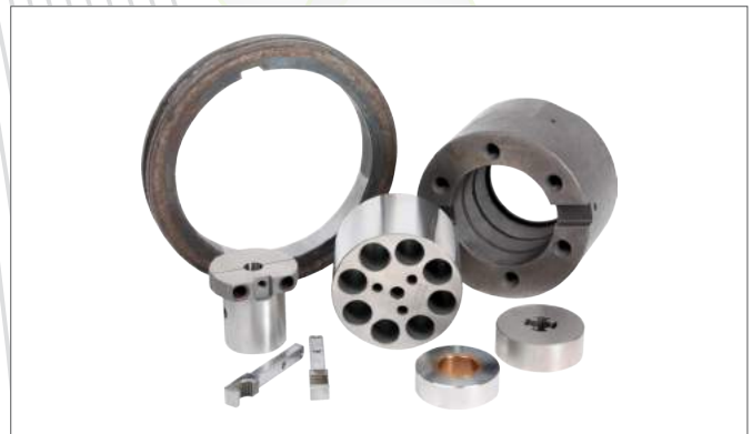
4. Accessories (Sleeve, Holder, Case, Liner, Spacer, Finger, etc)