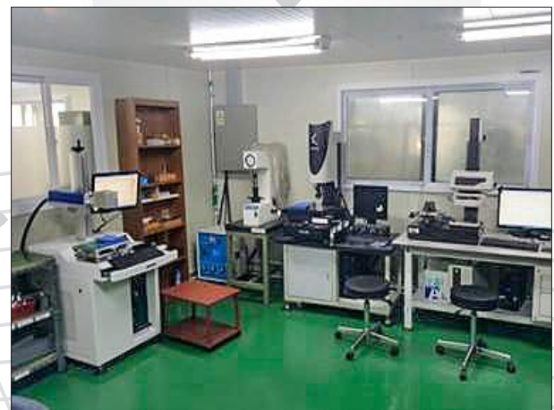
<Polishing & Q.C Dept>